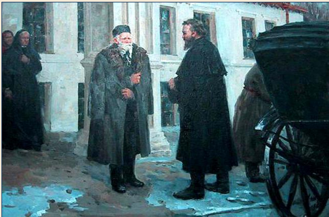
Приїзд М. В. Скліфосовського в садибу Вишня

М.І. Пирогов любив Н.В. Скліфосовського. Він рано вгадав в ньому талант та рекомендував на кафедру теоретичної хірургії. І не помилився. З нього вийшов великий російський та український хірург... Йому було сорок з невеликим, а ім'я його ставили поруч з ім'ям Пирогова.